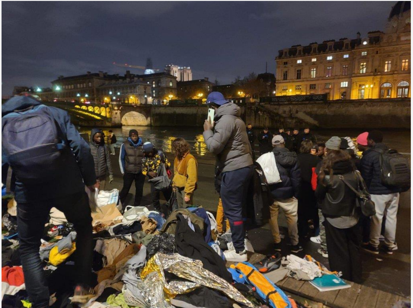
د پاریس له پون دو شانز څخه ایستل شوي کډوال.

پاریس کې د کم سنه کډوالو شمېر مخ په ډېرېدو دی