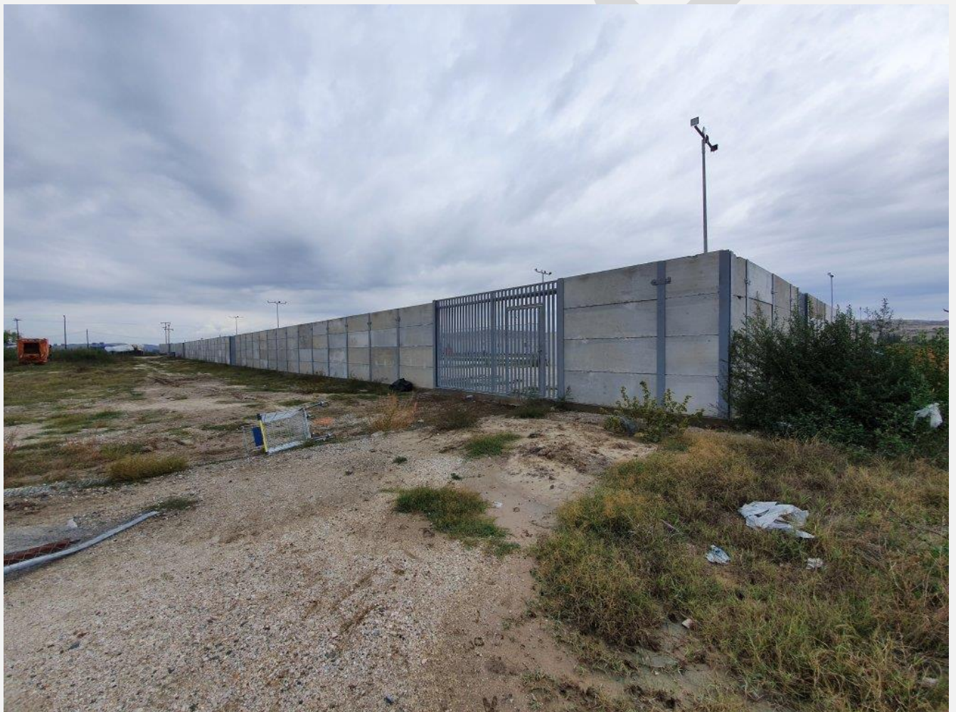
نیا کاوالا مهاجر کمپ.

په يونان کې مجردو کډوالو ته په میاشت کې ۷۵ یورو، جوړو او یا هغو یوازې مېندو او یا پلرونو ته چې یو ماشوم ورسره وي ۱۳۵ یورو، او څلورکسیزو کورنیو ته ۲۱۰ ورکول کېږي – په دې شرط چې دغه کسان سرپناه او خوړو ته لاسرسی ولري. د يونان د کډوالو شورا مشر وايي دا مبلغ زیات نه دی، خو کډوالو ته اجازه ورکوي چې خوراکي توکي واخلي او پخپله اشيږي وکړي.