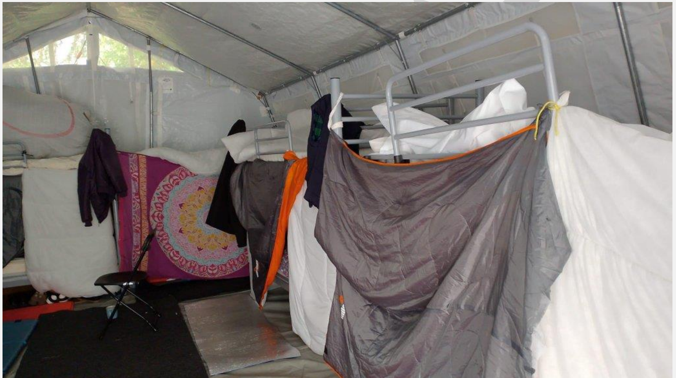
سنت برېج هوم کې د کډوالو خیمه.