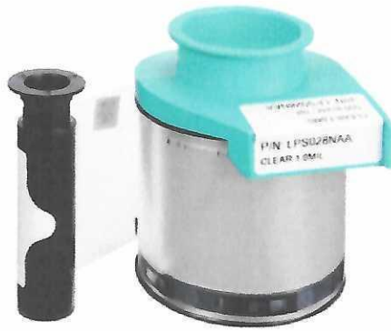
هید پاک ACL - Part# Cleaning Material