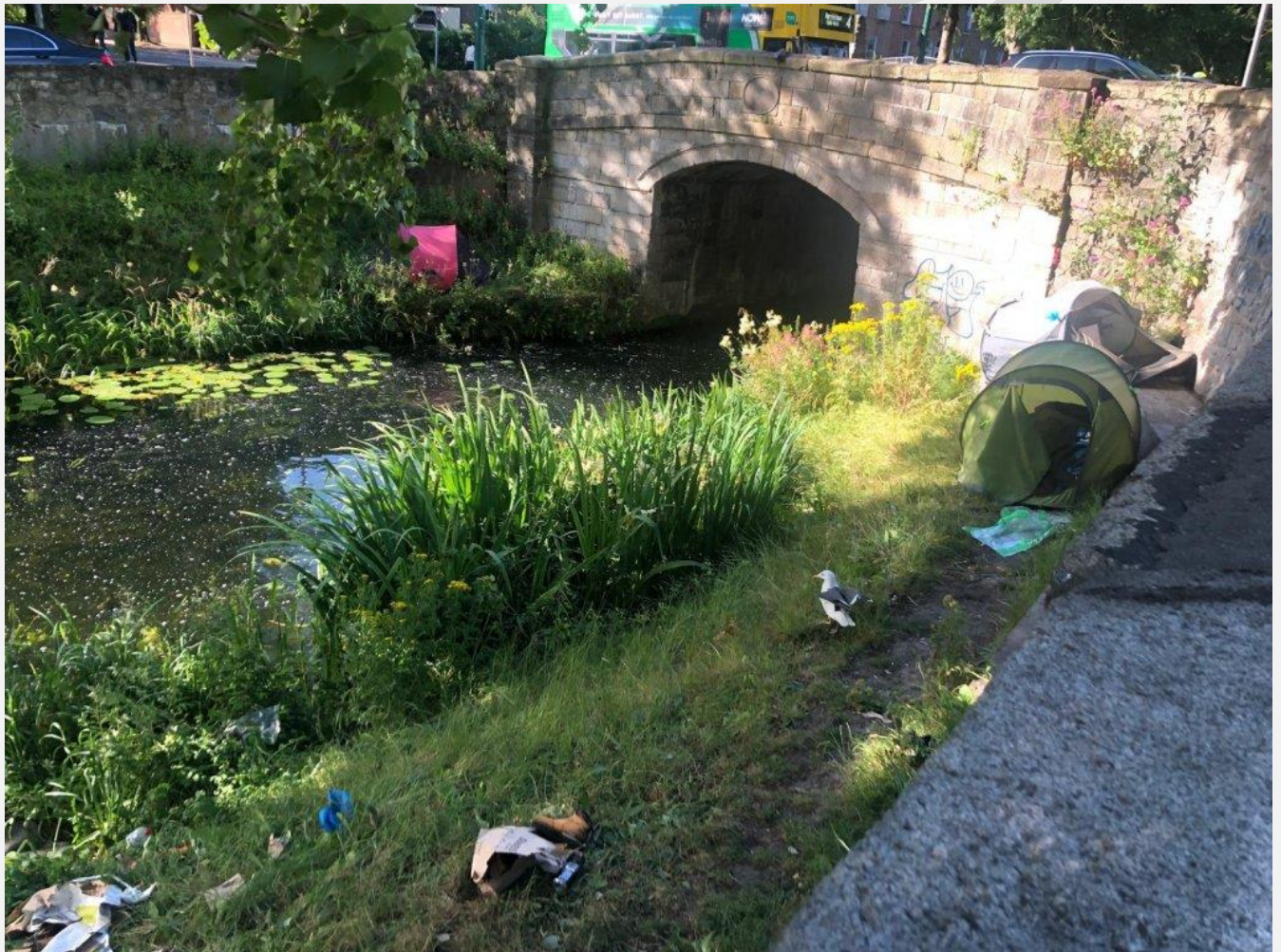
د اوبو کانال ته نږدې د کډوالو خيمه، د ۲۰۲۴ د جولای ۳.

نوموړې کمپونو کې د امکاناتو پر نشتوالي هم نيوکه کوي او وايي: «اوس هوا ښه شوې ده خو په ژمي کې خلکو په خورا سختو شرايطو کې تر خيمو لاندې ژوند کاوه. دلته مهاجر لومړنيو اسانتياوو لکه حمام او تشناب ته لاسرسی نه لري. د مدني ټولني له فعالانو پرته څوک ورسره مرسته نه کوي.» دغه فعاله زياتوي چې ځينو کسانو ته له دوو درېو ورځو څو ځينو نورو ته بيا تر اونیو انتظار وروسته سرپناه ورکول کېږي.