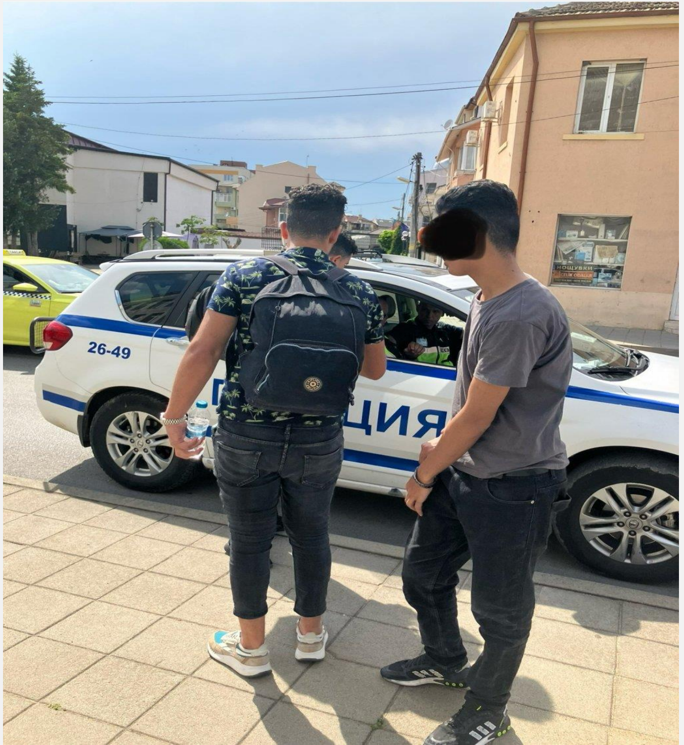
پولیس د مراکشیانو اسناد گوري، سویلنگراد، بلغاریا، د جون ۶.