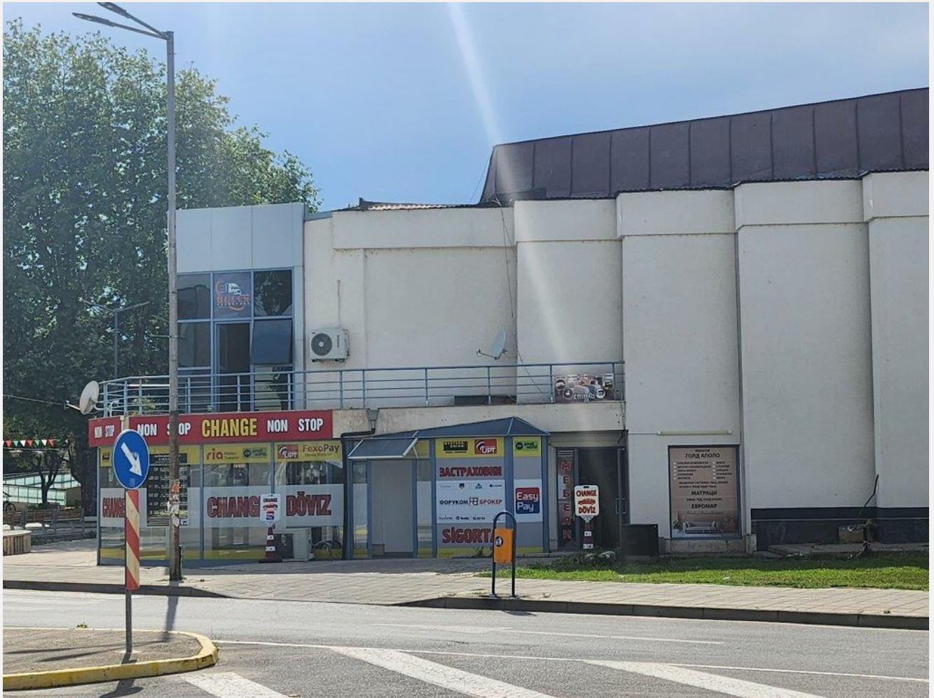
سویلنگراد، بلغاریا، د جون ۶.