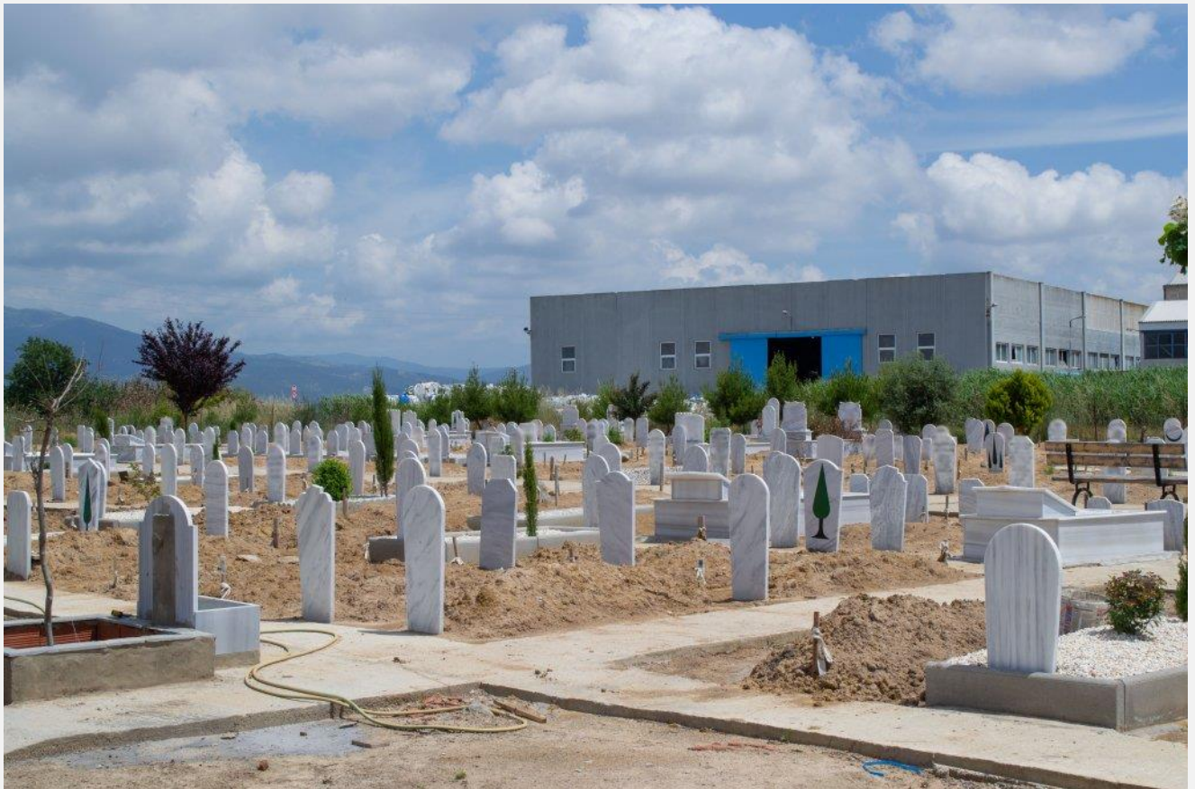
82 bodies were recovered after the Pylos shipwreck.

هنوز تحقیقات مقدماتی راجع به این دوسیه توسط محکمه امور بحری پیریوس جریان دارد، اما وکیلان بازماندگان می گویند که در اقدامات گارد ساحلی یونان قبل و بعد از این سانحه متوجه بی نظمی هایی شده اند.