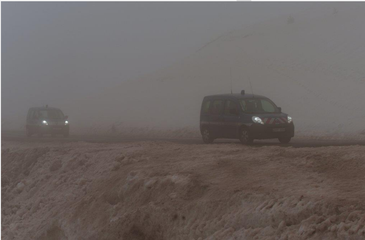
به گفته سازمان های اجتماعی، پولیس فرانسه مهاجران را بعد از دستگیری به ایتالیا پس می فرستد.

به دنبال افزایش ورود مهاجران از ایتالیا به فرانسه در ماه های اخیر، مقام های هردو کشور تصمیم گرفته اند کنترل در مرزهای مشترک خود را تشدید کنند. پاکرت فورست می گوید: «با وجود دشواری های مسیر آلپ، پولیس فرانسه تعداد زیادی از مهاجران را بعد از دستگیری به ایتالیا اخراج می کند. ما می خواهیم که همه قانون را رعایت کنند و مهاجران بتوانند به محض ورود به خاک فرانسه، درخواست پناهندگی کنند».