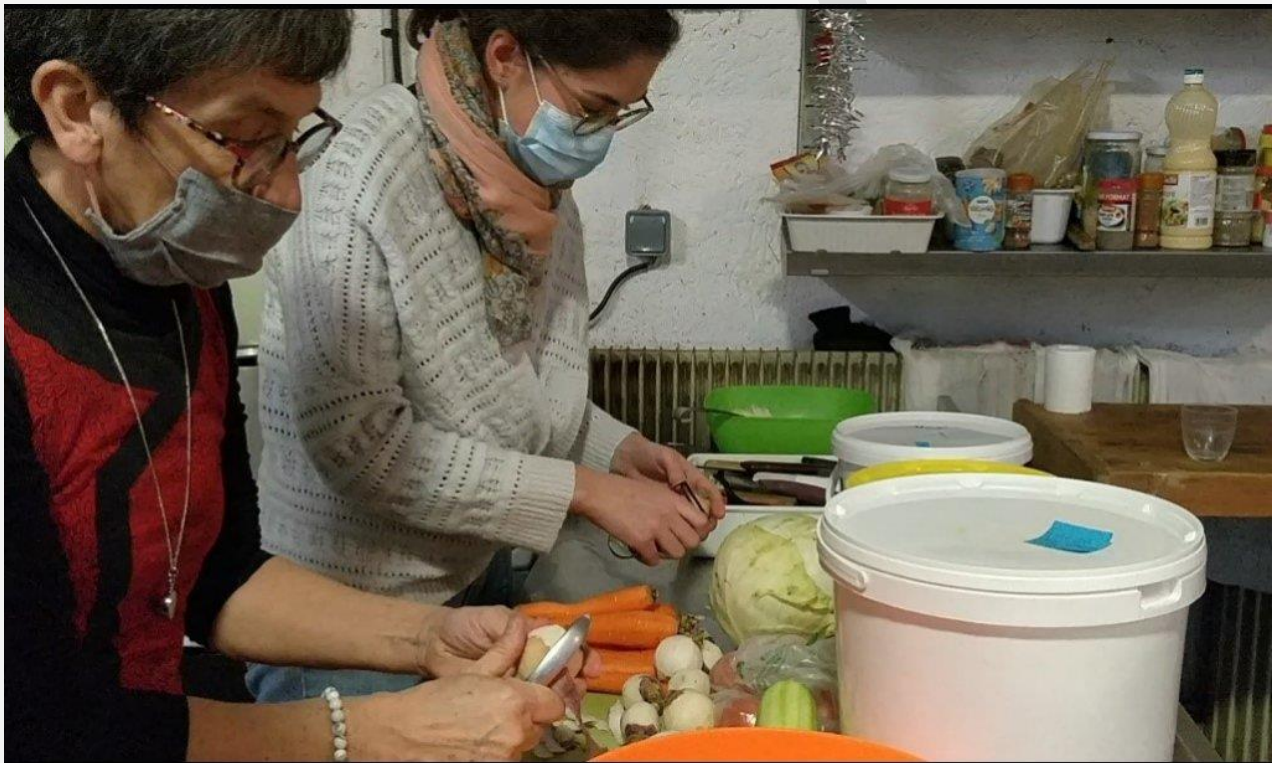
دو تن از رضاکاران پناهگاه رفوج سولیدر در بریانسون در حال تهیه غذا برای مهاجران، ۴ فبروری ۲۰۲۱.

پولیس این گروه را به ایتالیا اخراج کرد اما دوساعت مهاجران دوباره تلاش کردند وارد فرانسه شوند. فردای آن روز الفرد این مهاجر ایرانی را در بریانسون ملاقات کرده بود که با خوشحالی می گفت با عصا از کوه های آلپ عبور کرده است!