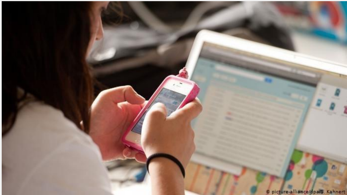
از سال ۲۰۱۷، مقام های آلمانی اجازه دارند داده های تلفن های هوشمند پناهجویان را بررسی کنند