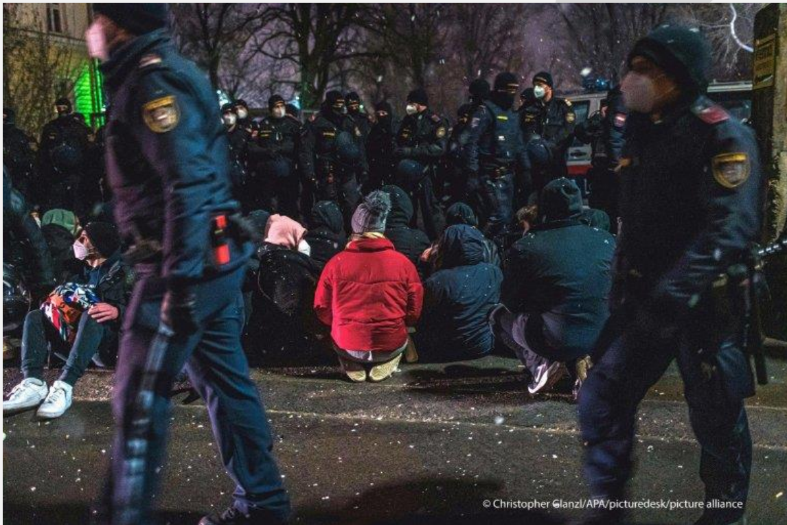
Photo: صدها شهروند اتریش در پیوند به اخراج سه دختر مهاجر به گرجستان و ارمنستان دست به اعتراض زدند Christopher Glanz/APA/picture alliance

گزارش ها می رسانند که دست کم ۱۹ معترض پس از ظهر روز شنبه در شهر اینسبروک در اتریش بازداشت شده اند. این گروه در پیوند به اخراج سه دانش آموز دختر به گرجستان و ارمنستان دست به اعتراض زده بودند .