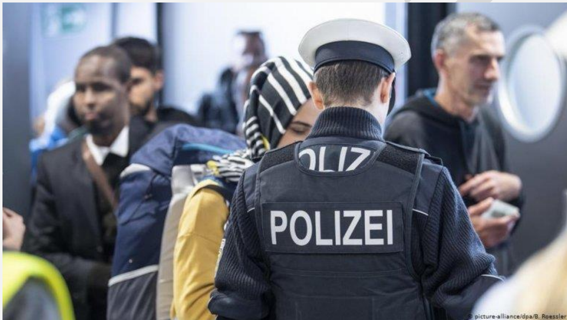
Picture-alliance/dpa/B. Roessler: یک مامور پولیس فدرال آلمان اسناد یک مسافر را در میدان هوایی فرانکفورت بررسی می کند. /عکس

گروه رسانه ای "فونکه" با توجه به اطلاعات پولیس فدرال آلمان گزارش داده است که در سال ۲۰۲۰، در مقایسه به یک سال گذشته آن، آمار سفرهای غیرقانونی از طریق هوا، از یونان به آلمان کاهش یافته است. بر بنیاد اطلاعات پولیس، آنان در سال ۲۰۲۰ حدود ۵۲۰۰ نفر را پیش از پرواز در میدان های هوایی یونان شناسایی کرده اند. این رقم در سال ۲۰۱۹ به دست کم ۵۸۰۰ مورد می رسید.