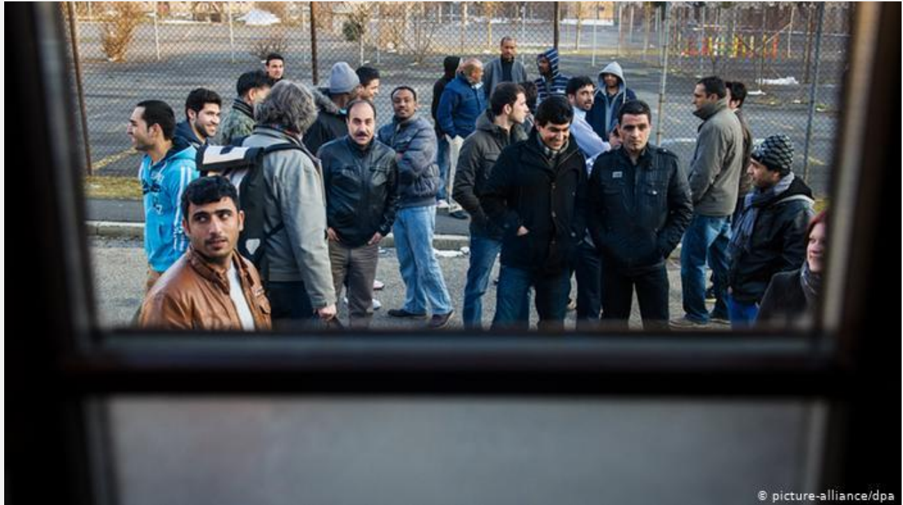
عکس از آرشیو؛ ساکنان خانه پناهندگان در وورتسبورگ در ۱۴ مارس ۲۰۱۳ در انتظار گفتگو با وزیر امور اجتماعی بایرن درباره وضعیت پناهندگان در این ایالت

در آستانه استقرار دولت جمهوری اسلامی در ایران و نیز درست بعد از آن، اولین گروه که نزدیکان و هواداران رژیم سلطنت بودند به مهاجرت رفتند. این گروه بیشتر راهی کشورهای امریکا و کانادا شدند. ایران در همین زمان شاهد بازگشت گروهی از مهاجران و تبعیدیان بود که بعد از سالها از اروپا و دیگر کشورها برمی گشتند. عده‌ای از آنها چندی بعد دوباره مجبور به ترک ایران شدند.