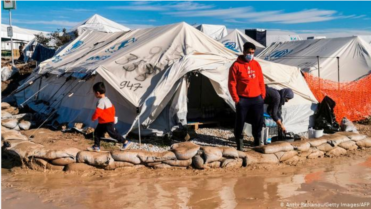
اردوگاه پناهجویان کاراتیپه در جزیره لیسبوس یونان

کمیسیون اتحادیه اروپا اعلام کرده که این رقم با ۱۱۴ هزار و ۳۰۰ عبور غیرقانونی مرزی بین ماه های جنوری و نوامبر سال گذشته، پایین ترین سطح را در شش سال گذشته را نشان می دهد. در مقایسه با مدت مشابه سال گذشته این یک کاهش ۱۰ درصدی را نشان می دهد. تعداد درخواست های پناهندگی بین ماه جنوری و اکتوبر حتی ۳۳ درصد کمتر در مقایسه با مدت مشابه سال گذشته است. در مجموع ۳۹۰ هزار پناهجو درخواست پناهندگی ارائه کرده اند که ۳۴۹ هزارشان درخواست های اولیه بوده است.