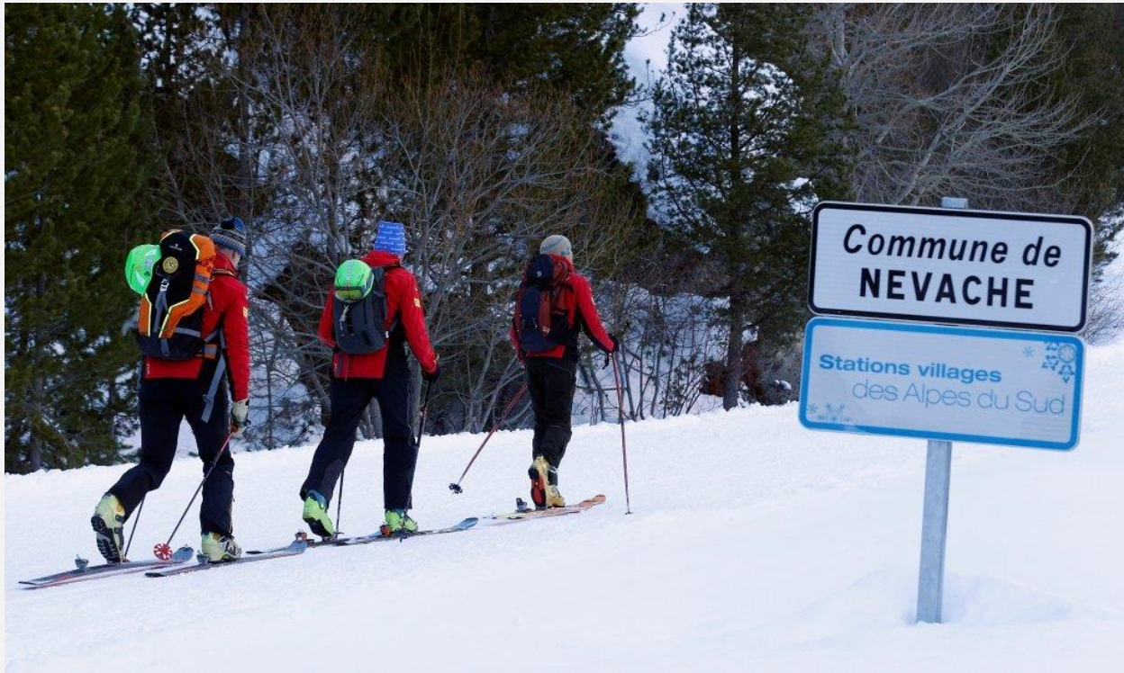
امدادگران در کوه‌های آلپ

نیروهای امدادی و پولیس مرزی فرانسه بعد از جستجو، هردو مهاجر را هنگامی پیدا کردند که از سردی هوا به تشناب‌های یک مرکز اسکی پناه برده بودند.