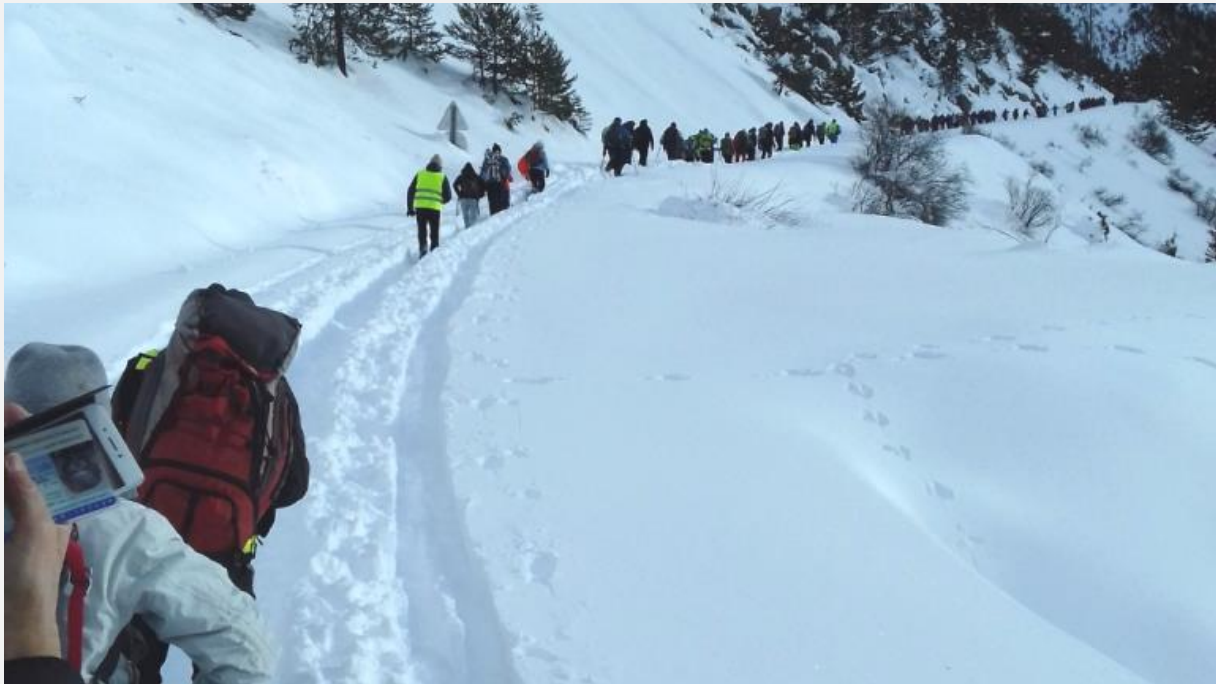
امدادگران در کوه‌های آلپ فرانسه.

سازمان‌های همه مهاجران و داکتران دنیا (MDM) با انتشار خبرنامه‌ای از افزایش فشارها بر امدادگران از سوی پولیس اظهار نگرانی کردند.