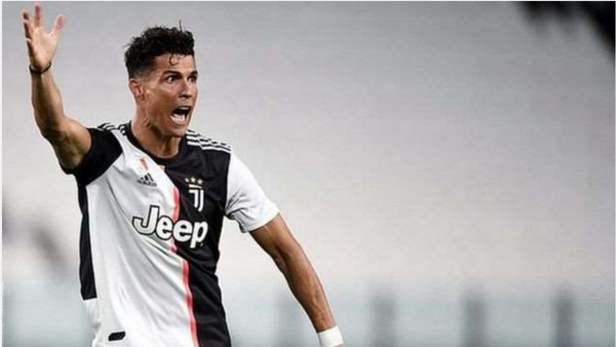
رونالدو ژوئیه ۲۰۱۸ به یوونتوس ملحق شد

در دوران بچگی هیچکدام از آنها هرگز با تمام وجود از پیروزی تیمشان خوشحال نمی‌شدند، اگر در آن نقش اساسی نداشتند.