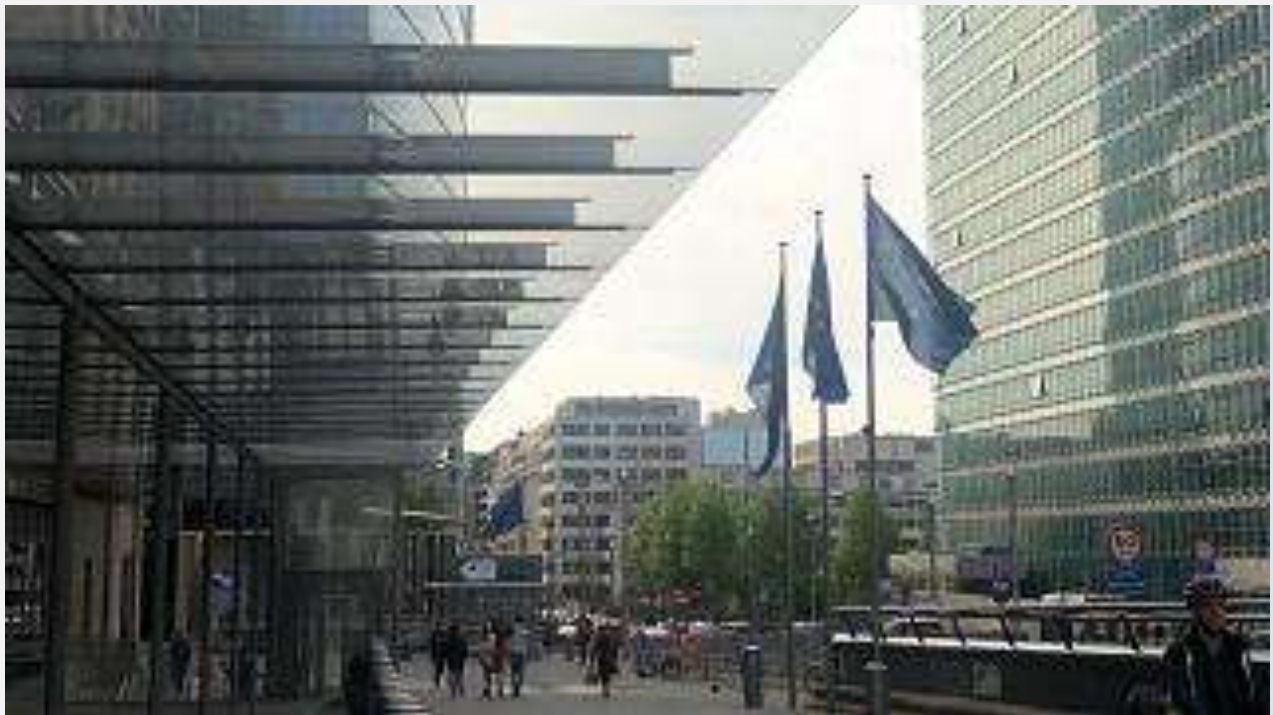
اتحادیه اروپا

بیشترین موارد دریافت نخستین کارت اقامت اتحادیه اروپا در سال ۲۰۱۹ مربوط به اتباع اوکراین و مراکش بوده است.