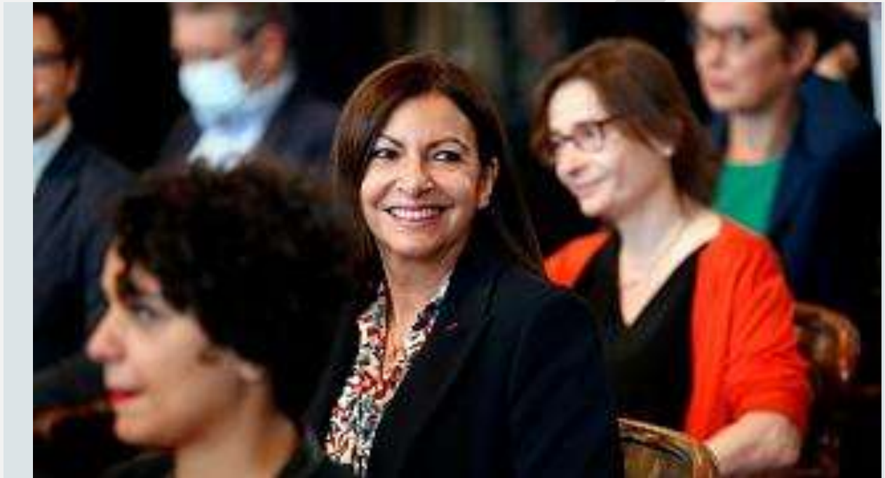
ان ایدالگو، شهردار پاریس

شهرداری پاریس به دلیل استخدام بیش از حد زنان در پست‌های بالای مدیریتی در سال ۲۰۱۸، ۹۰ هزار یورو جریمه شد.