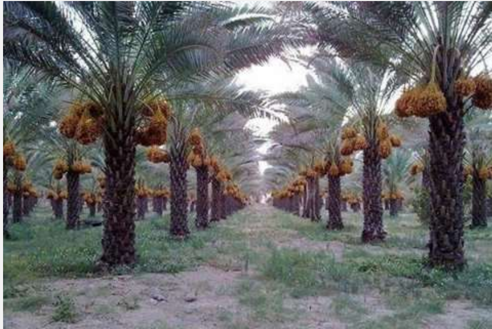
(حاصل دهی نخستین باغ خرما در ولایت ننگرها)

به گفته رئیس زراعت قندهار، روند ساخت این باغهای تجارتي به شکل رسمي در ولسوالی دامان به گونه رسمي آغاز شده است.