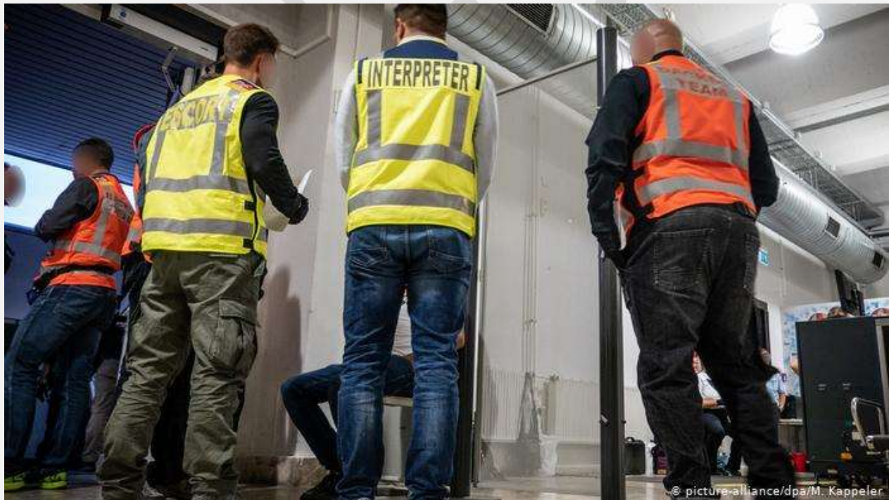
تصویر نمادین از اخراج ها

نه ماه پس از توقف روند اخراج مهاجران رد شده از آلمان، قرار است گروه دیگری از پناهجویان افغان از این کشور اخراج شوند. هواپیمای حامل این افراد فردا پنجشنبه در میدان هوایی کابل نشست خواهد کرد.